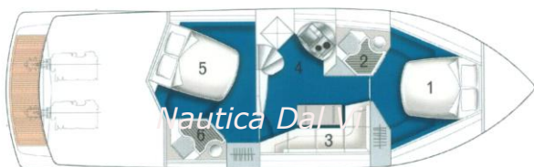
pianta interni interior lay-out